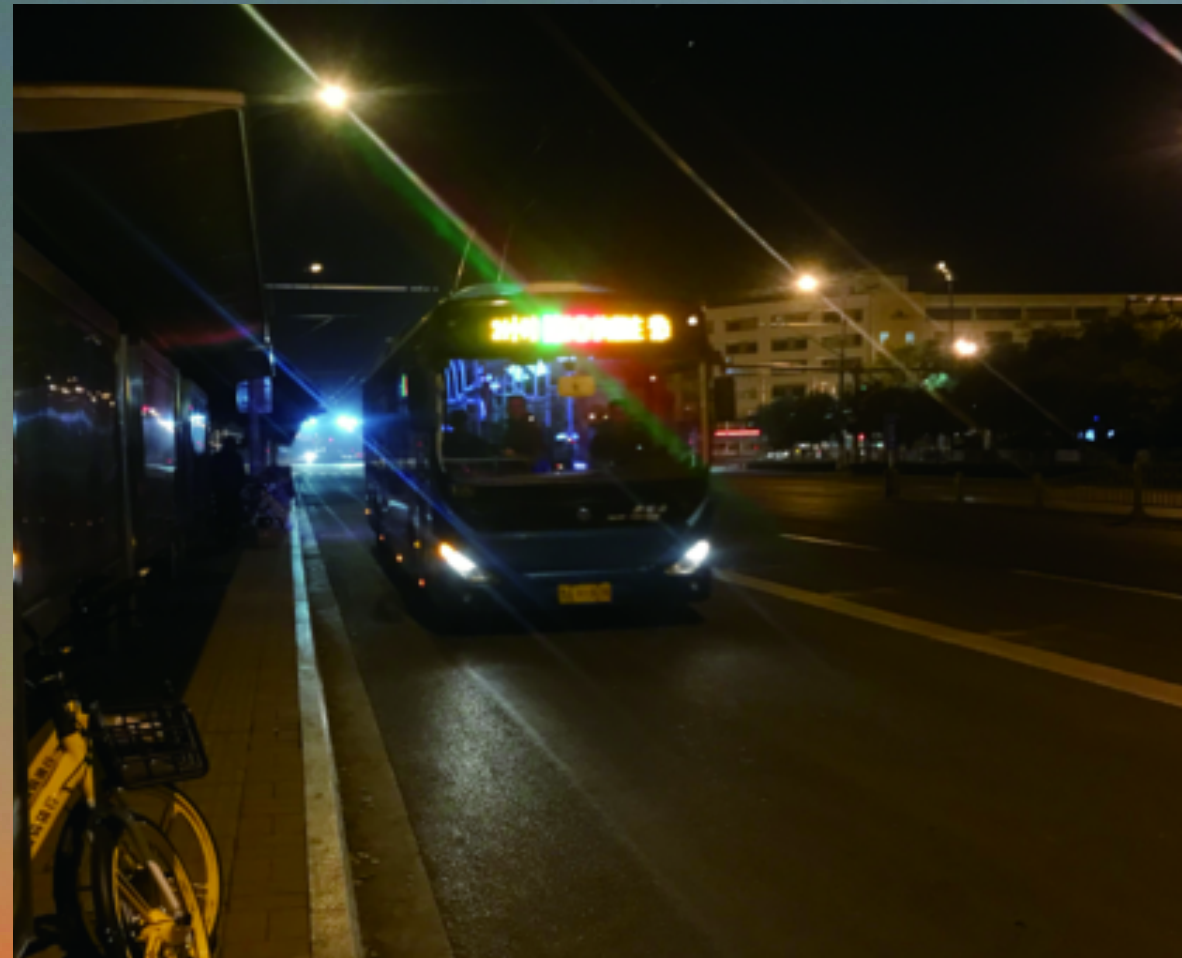
济南首条 24 小时公交 K101 路途经老城区多个重要商圈、景区、医院,大大方便了市民的出行,对泉城“夜经济”是极好的助力。